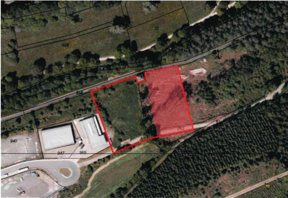
Lageplan 2. Änd. Bebauungsplan 94 (ohne Maßstab)

des Ortsteils Kirchveischede und umfasst das im nachstehenden Lageplan markierte Gebiet.